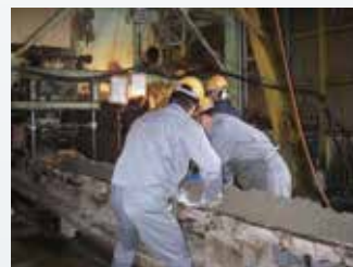
コンクリート投入